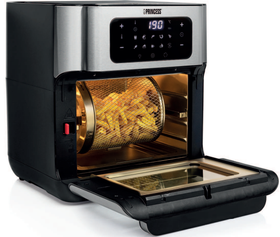
Aerofryer Oven 01.182065.01.001

PARTS DESCRIPTION / ONDERDELENBESCHRIJVING / DESCRIPTION DES PIÈCES / TEILBESCHREIBUNG / DESCRIPCIÓN DE LAS PIEZAS / DESCRIZIONE DEI COMPONENTI / DESCRIZIONE DELLE PARTI / BESKRIVNING AV DELAR / OPIS CZĘŚCI / POPIS SOUČÁSTÍ / POPIS SUČASTI / ОПИСАНИЕ ЗАПЧАСТИ