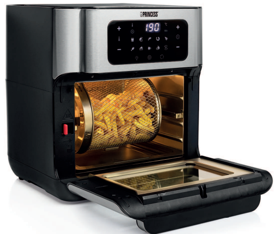
Aerofryer Oven 01.182065.01.001

PARTS DESCRIPTION / ONDERDELENBESCHRIJVING / DESCRIPTION DES PIÈCES / TEILEBESCHREIBUNG / DESCRIPCIÓN DE LAS PIEZAS / DESCRIÇÃO DOS COMPONENTES / DESCRIZIONE DELLE PARTI / BESKRIVNING AV DELAR / OPIS CZĘŚCI / POPIS SOUČÁSTI / POPIS SUČASTI / ОПИСАНИЕ ЗАПЧАСТИ