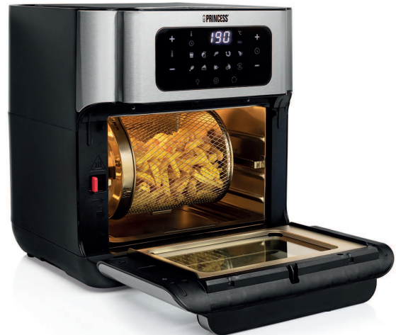
Aerofryer Oven 01.182065.01.001

PARTS DESCRIPTION / ONDERDELENBESCHRIJVING / DESCRIPTION DES PIÈCES / TEILEBESCHREIBUNG / DESCRIPCIÓN DE LAS PIEZAS / DESCRIÇÃO DOS COMPONENTES / DESCRIZIONE DELLE PARTI / BESKRIVNING AV DELAR / OPIS CZĘŚCI / POPIS SOUČÁSTÍ / POPIS SUČASTI / ОПИСАНИЕ ЗАПЧАСТИ